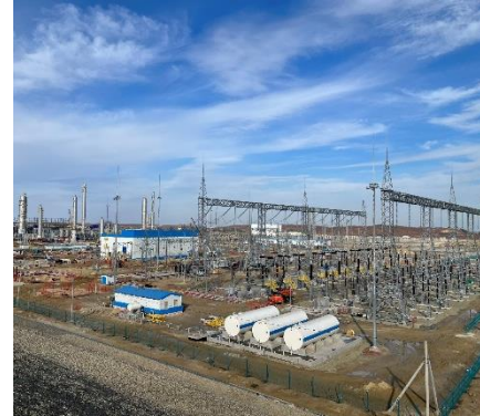
Амурский газохимический комплекс (АГХК)