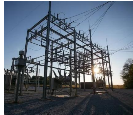
КЛ 220 кВ Усть-Кут – Ковыкта